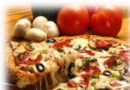
Pizza à 345°C